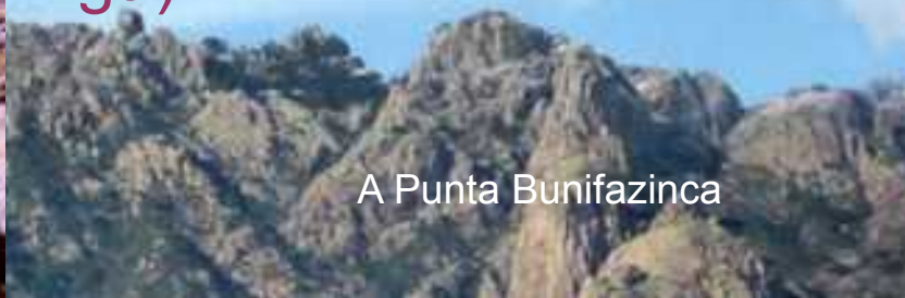
A Punta Bunifazinca